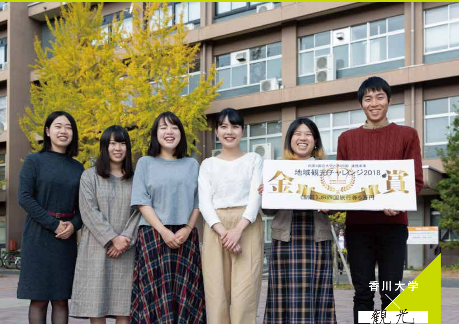
香川大学 × 観光