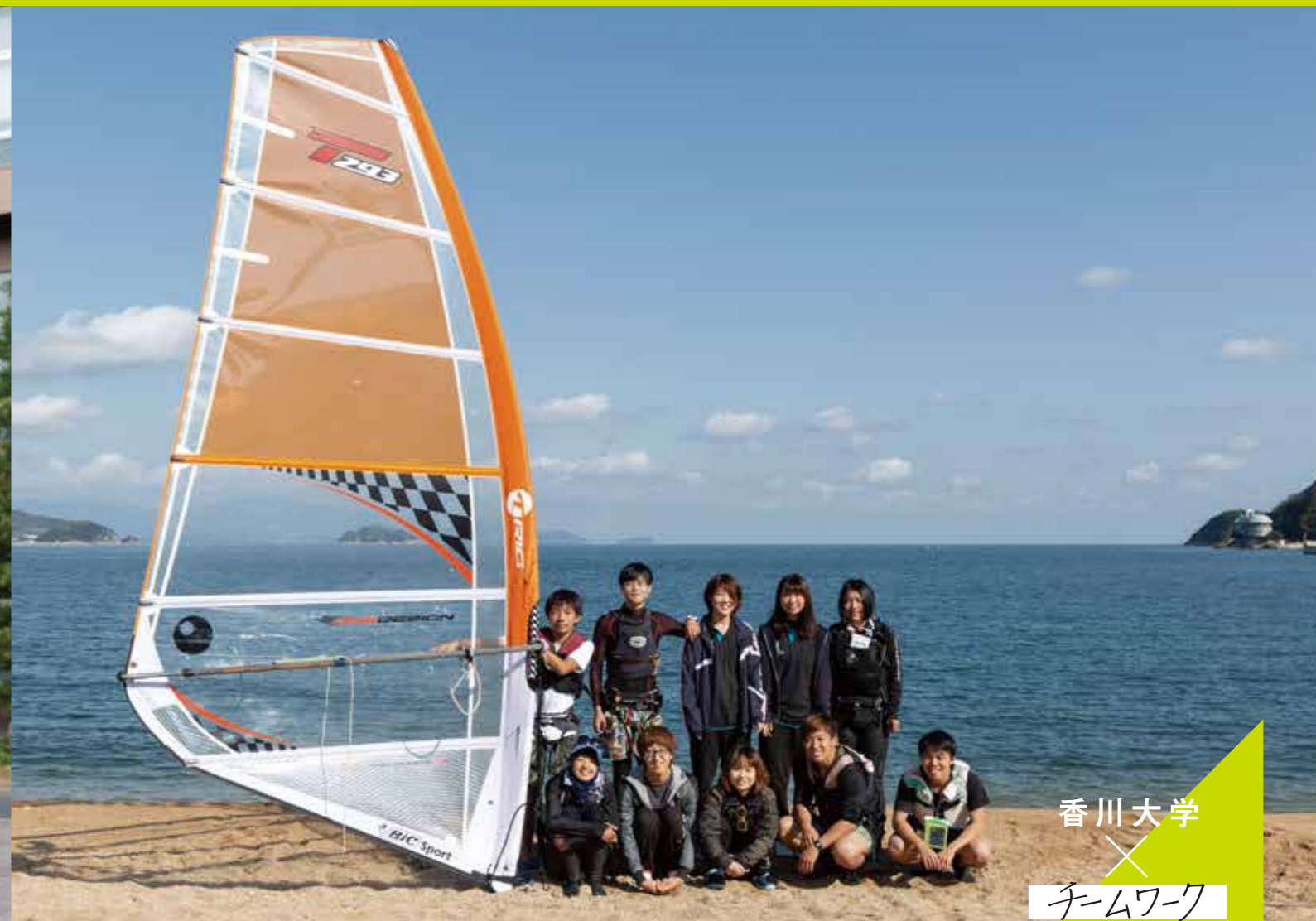
香川大学 × チームワーク

銀賞を受賞したまるかんガールズの『香川でココロとカラダすっきり「美」カアップツアー～オリーブ園でヨガ教室&産地消ダイニング～』は、健康的なランチ、ショッピング、オリーブや薬膳のレクチャーなど、女性好みのコンテンツが盛りだくさん。香川県らしいオリーブの木々の下でのヨガ教室は特に魅力的です。先行事例や市場動向の調査、文献研究、マーケティング学習を経て、フィールドワーク、企画立案、地域の方々と関係を築き協力を得るまでの全てを学生が遂行。学生たちにとっても、地域とそこに生きる人々の魅力を知る、宝物のような時間になりました。2019年の春、この2つの旅プランがJR四国の商品として発売されることが決定しました。フレッシュな発想から生まれた旅にぜひ参加してください。