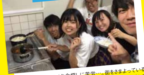
オリーブ牛カレーうどんで夕食!

この日の小豆島は台風で夕食探しに苦労…。街をさまよっている学生たちに声をかけてくださった地域の方の家でコーヒーをごちそうになり、思いがけず小豆島の話聞く機会に恵まれました。胸いっぱい帰路に。結局夕食は宿舎で、オリーブ牛カレーうどんを自分たちで作って食べました。