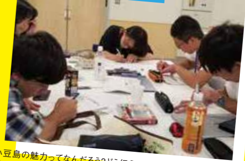
プレゼンテーション準備

小豆島の魅力ってなんだろう？どう伝えたいんだろう？夜遅くまでプレゼン準備は続きます。いままでも小豆島を知らなかったという芝浦工業大学生が感じた視点も参考に、新たな角度からのものを見る大切さを感じることができました。