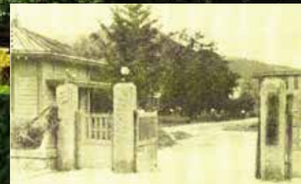
旧香川大学正門(元高松高商東門・昭和24年)