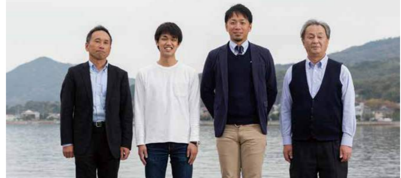
産官学の協力があったからこそKaDaxiの実証実験が実現しました。