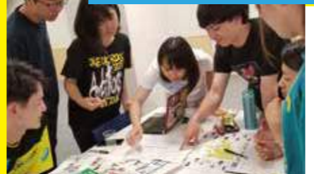
アイデア出し & プロトタイプ作成

同じ活動をしていても、一人ひとりの感じ方や視点はさまざま。アイデアを出しあうことは新たな発見の連続。それをひとつに集約していく作業は、苦しくも楽しい作業です。両大学の学生ともにデザイン思考を学んでいることから、共有できることも多かったという学生の声もありました。