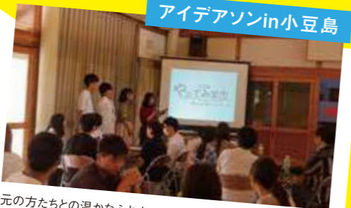
アイデアソン in 小豆島

地元の方たちとの温かなふれあい、地引網・稲刈り体験、醤油蔵・農村歌舞伎舞台の見学、島に移住してきた方や活性化に尽力する人たちの話……。5日間で体験したすべての学びに大学生ならではのアイデアを加え、小豆島の魅力を提案する最終プレゼン。